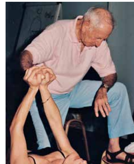
Dr. Alexander Lowen 1994 während eines NIBA-Workshops in Vlotho.